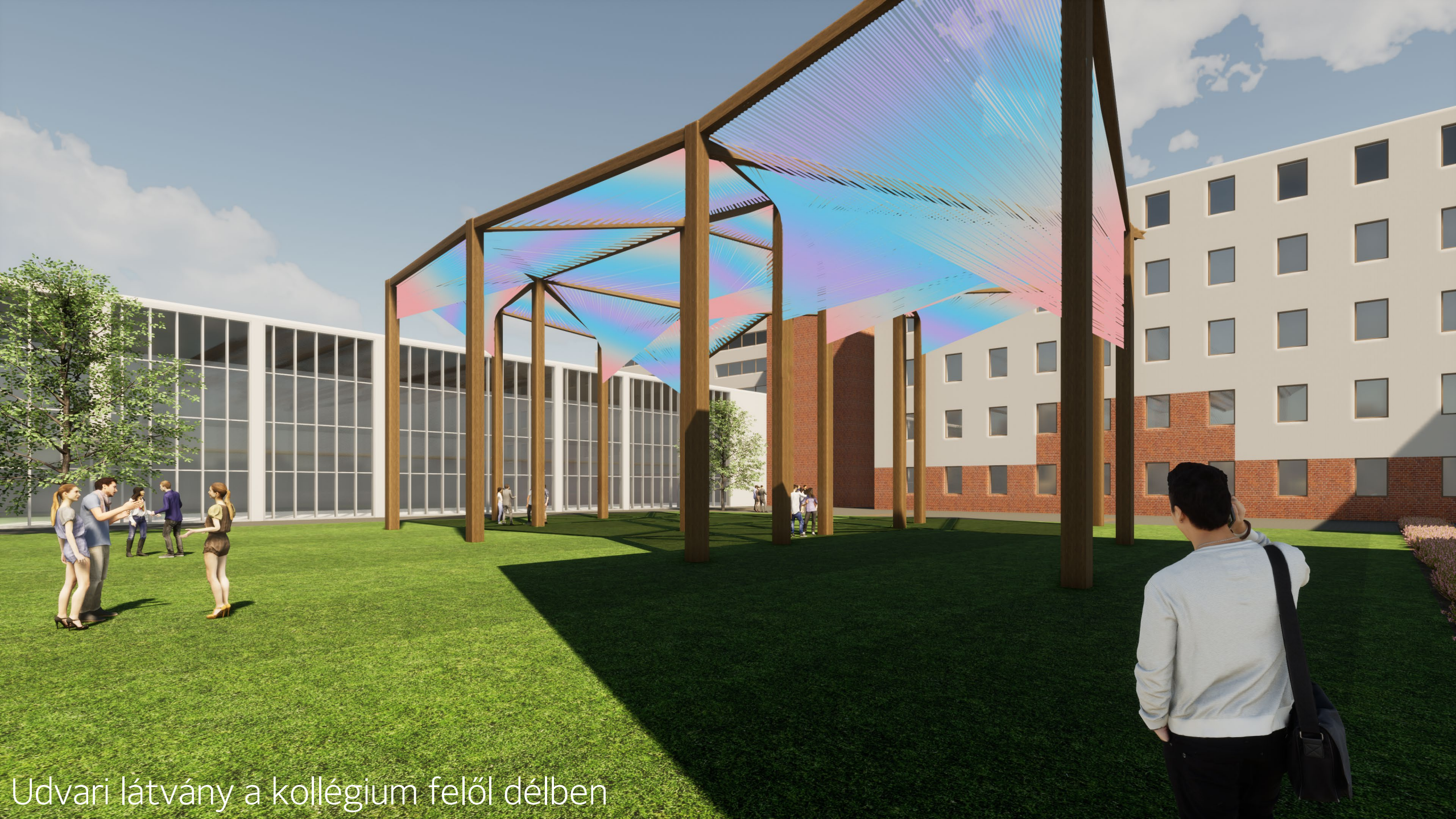
Udvari látvány a kollégium felől délben