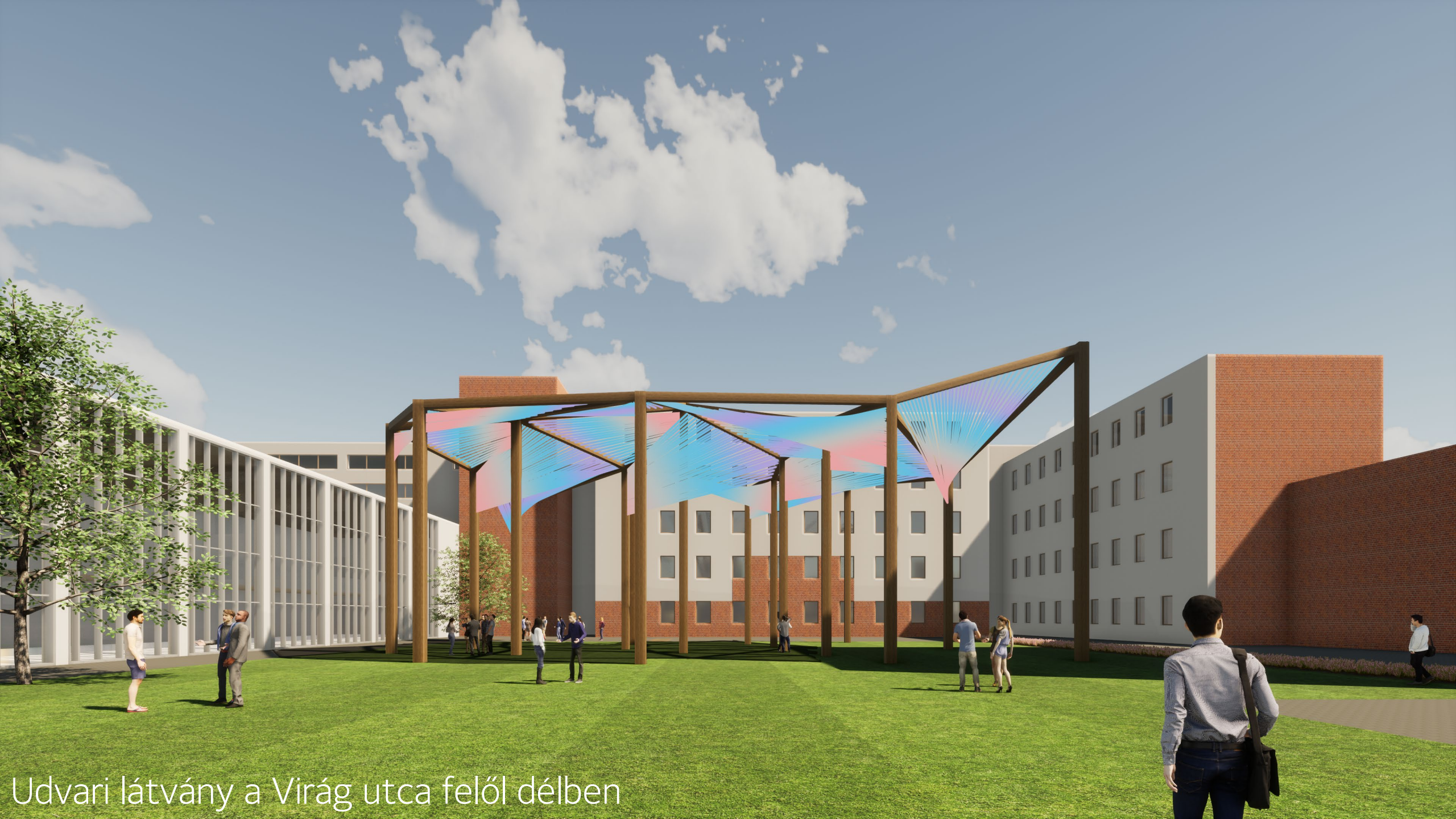
Udvari látvány a Virág utca felől délben