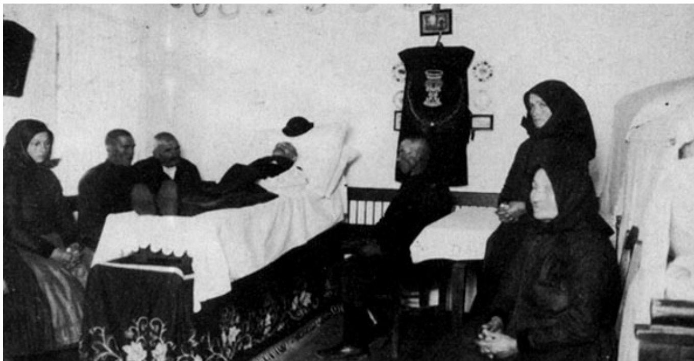
[1] Református halottas ház belseje

Végül az elkészült ravatalra fektették a halottat. „A halottat vagy az alatta levő lepedő visszahajtásával, vagy újabb lepedővel derékig, mellig betakarták. Ezt hívják szemfedőnek. Néhol éjszakára teljesen betakarták a testet: „hadd aludjon”, s csak nappal vonták le róla derékig, térdig a szemfedőket. A halott fejéhez – családi, vagy közösségi tulajdonban lévő, templomban őrzött – halottas keresztet állítottak. Melléje kétoldalt – s ha tehetik; a halott lábához is – szentelt gyertyát tettek.” 3