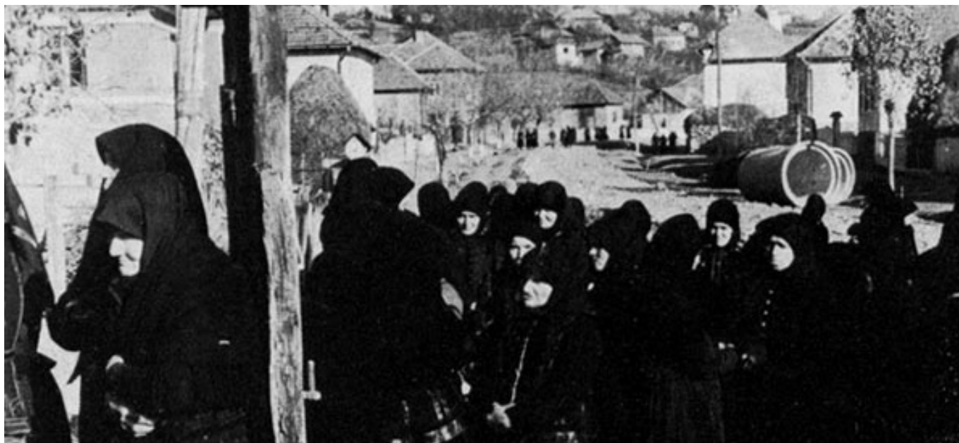
[2] A halott búcsúztatására érkező asszonyok a porta kapujában

A koporsót a ravatal mellé helyezték. Először forgácsot, nádat tettek bele, majd egy forgáccsal töltött párnát helyeztek el benne, ezt követően pedig a halottat is belefektették a halotti lepedővel együtt. Az elhunyt mellé különböző tárgyakat is helyeztek, például a túlvilágra szánt használati eszközöket – ruhát, pénzt vagy ételt –, valamint védelmező, amulettszerű tárgyakat. Ezt követően a koporsót visszahelyezték a ravatalra, vagy magát a ravatalt elbontották és annak a helyére tették a koporsót. Lepedővel szemfedőt adtak a halottnak, majd lezárták a koporsót, ezzel pedig véget ért a ház szerepe a szertartásban.