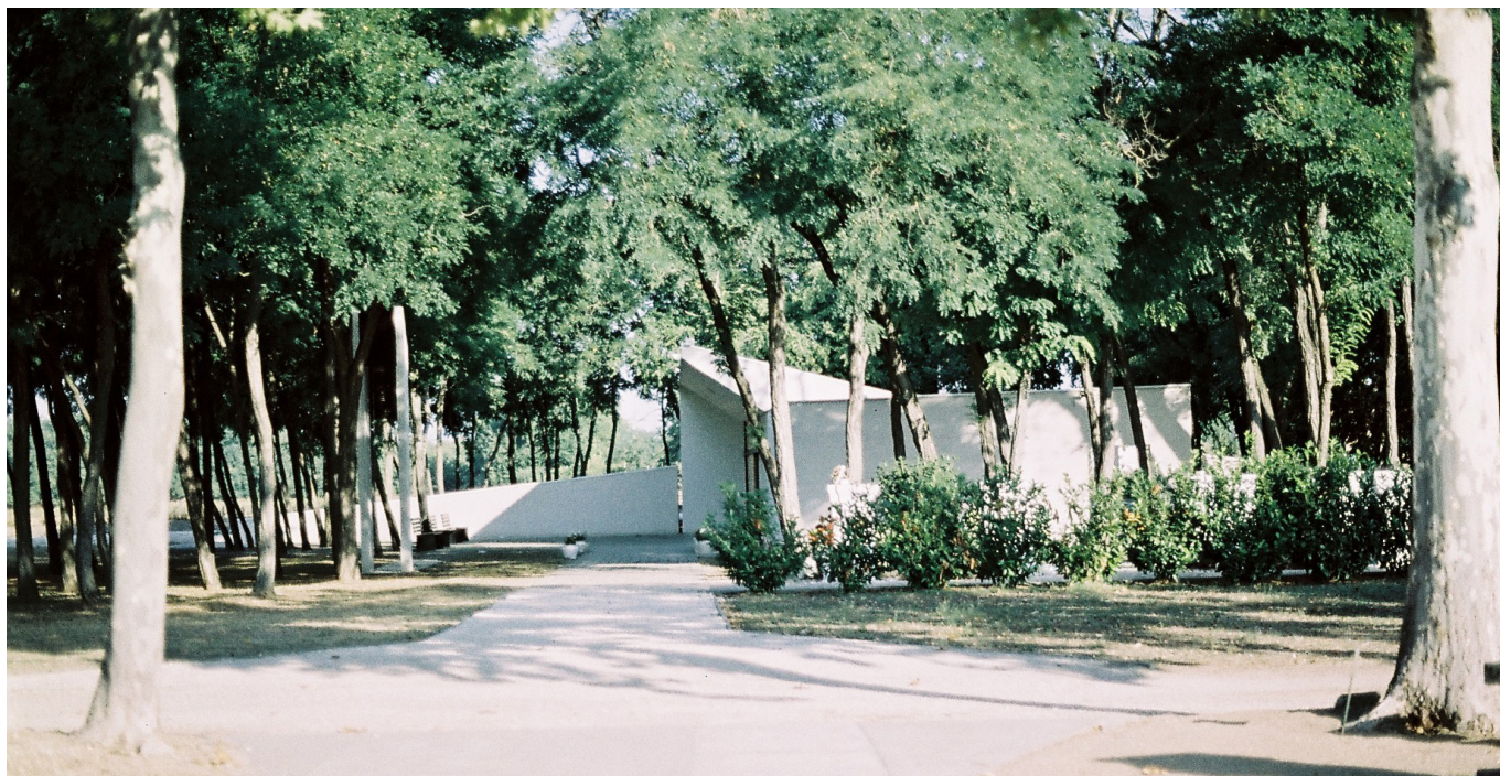
[8] A Dabas-Gyóni ravatalozó

A dabas-gyóni ravatalozó jól mutatja, hogy a kortárs ravatalozóépítészet képes lehet újrafogalmazni a halálhoz kapcsolódó tereket. Az épület nem a hagyományos szakrális formák másolásával próbál jelentést teremteni, hanem a tér, a fény, az anyagok és a metaforikus építészeti gesztusok segítségével. 9, 10