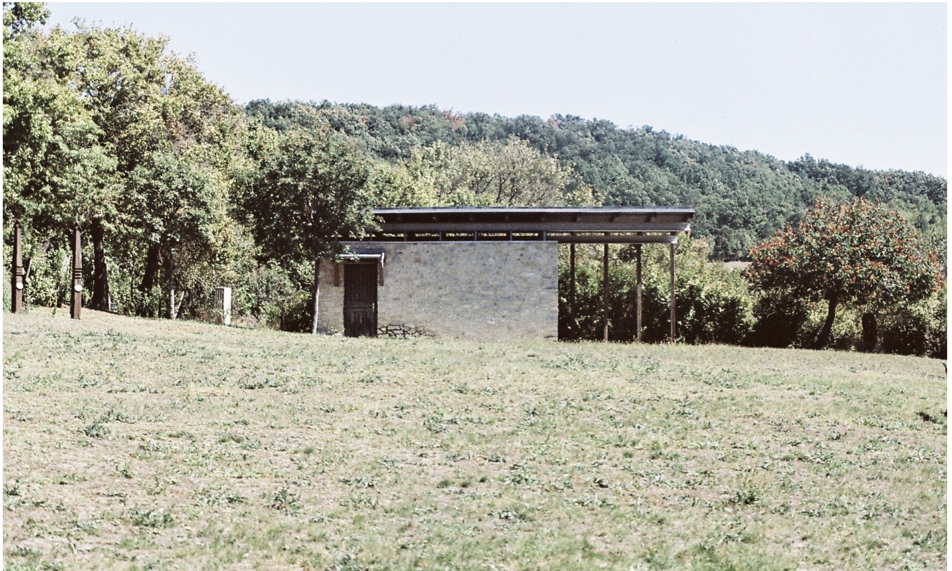
[9] Felsődörgicse dombján

A felsődörgicsei ravatalozó így egy olyan építészeti állításként értelmezhető, amely a minimalizmus eszközeivel, de erős szellemi tartalommal dolgozik. Nem a formai gesztusok hangsúlyossága, hanem a tér és anyag finom arányai adják meg a jelentését, miközben a helyhez kötöttség és a tájjal való kapcsolat végig meghatározó marad. 11