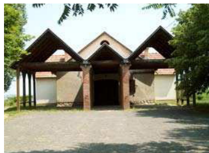
[6] Példák a gyűjteményből