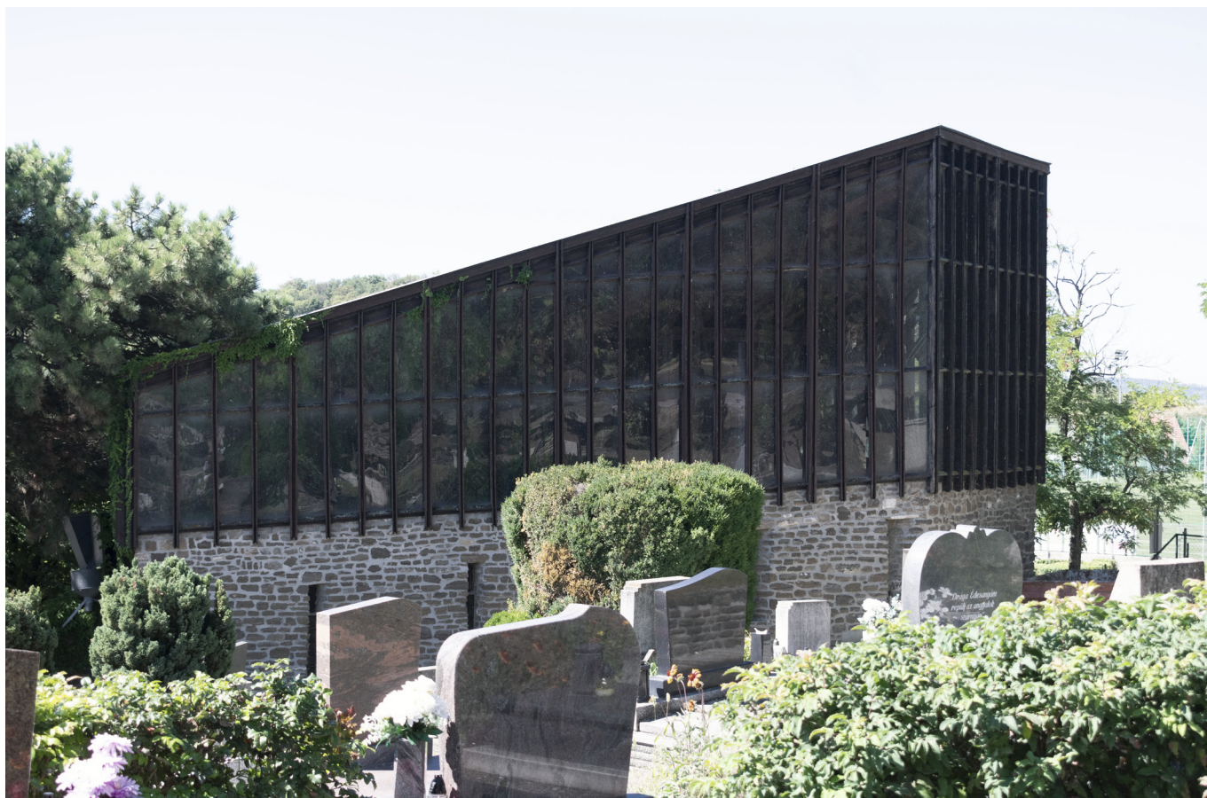
[10] A tihanyi ravatalozó

Ez az épület nem dramatizálja a búcsú pillanatát, inkább keretet ad neki. A térszervezés, a fények mozgása és a természet közelsége együtt hoz létre egy olyan atmoszférát, amelyben az építészet nem dominál, hanem közvetít. 12, 13