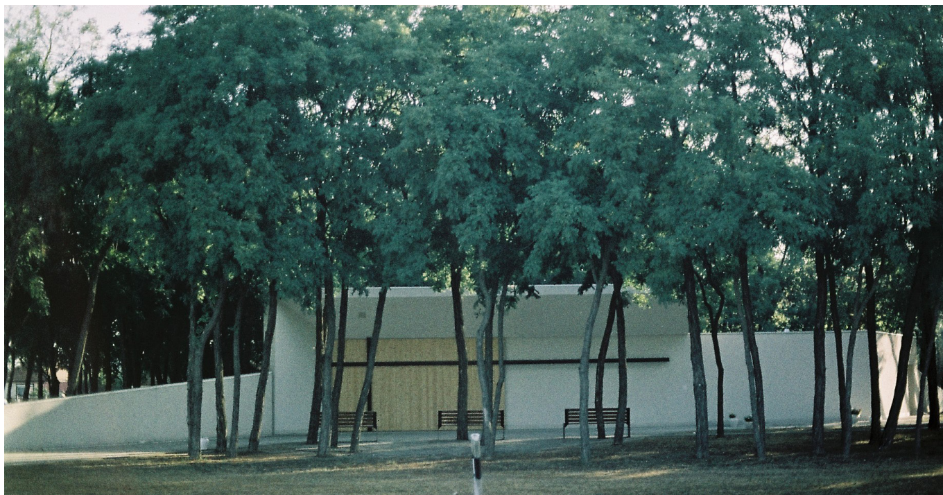
[7] A Dabas-Gyóni ravatalozó

A tolófal megnyitásával a külső és belső tér összeolvad, így a szertartás nem szorul be az épület falai közé. Ez különösen fontos gesztus egy olyan épülettípus esetében, amely korábban a szabadban, a ház és a falu tereiben zajló közösségi esemény volt. A ravatalozó így nem teljesen zárja el a halált a környezettől, hanem megpróbál kapcsolatot teremteni az épület, a táj és a gyászolók között.