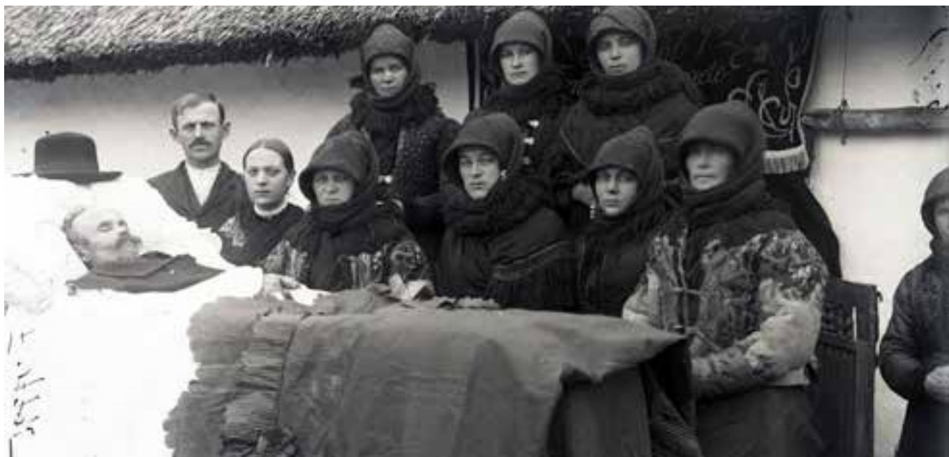
[3] Ravatal az udvaron

A gyásznép – amely a nyitott nagykapun keresztül érkezett – az udvaron gyülekezett, ahol addigra már előkészítették a helyszínt a pap, a vendégek és a búcsúztatás számára. A koporsót kivitték a házból, majd – a benti elrendezéshez hasonlóan – úgy helyezték el, hogy a lábész a kijárat, vagyis a kapu felé nézzen.