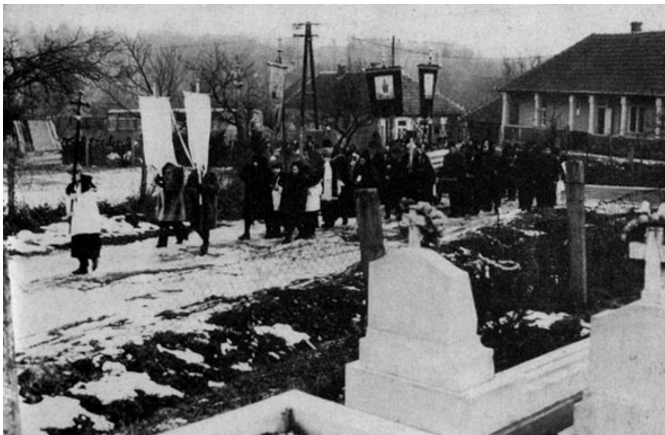
[5] Temetőhöz közeledő halottas menet