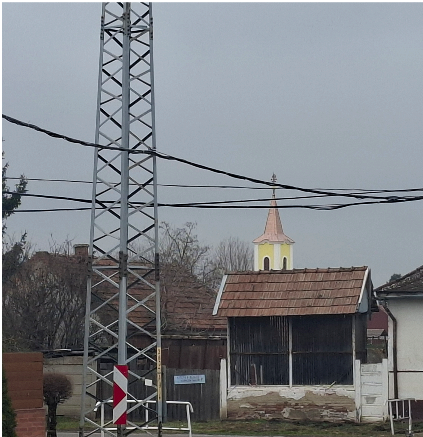
[1]. ábra: Létavértesi utcakép