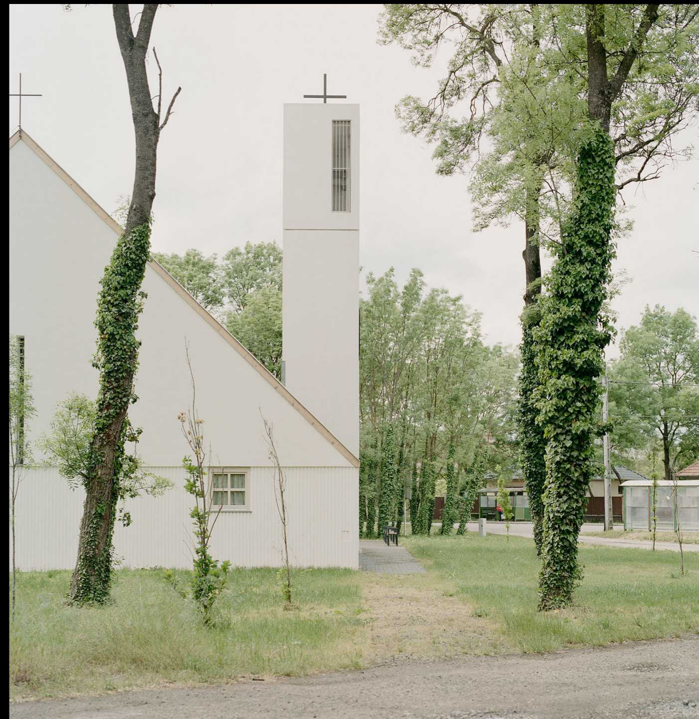
[6]. ábra: A derekegyházi Szentháromság-templom külső részlete (Építész: Váncza Művek) Forrás: Építészfórum (2022) (Fotó: Danyi Balázs).