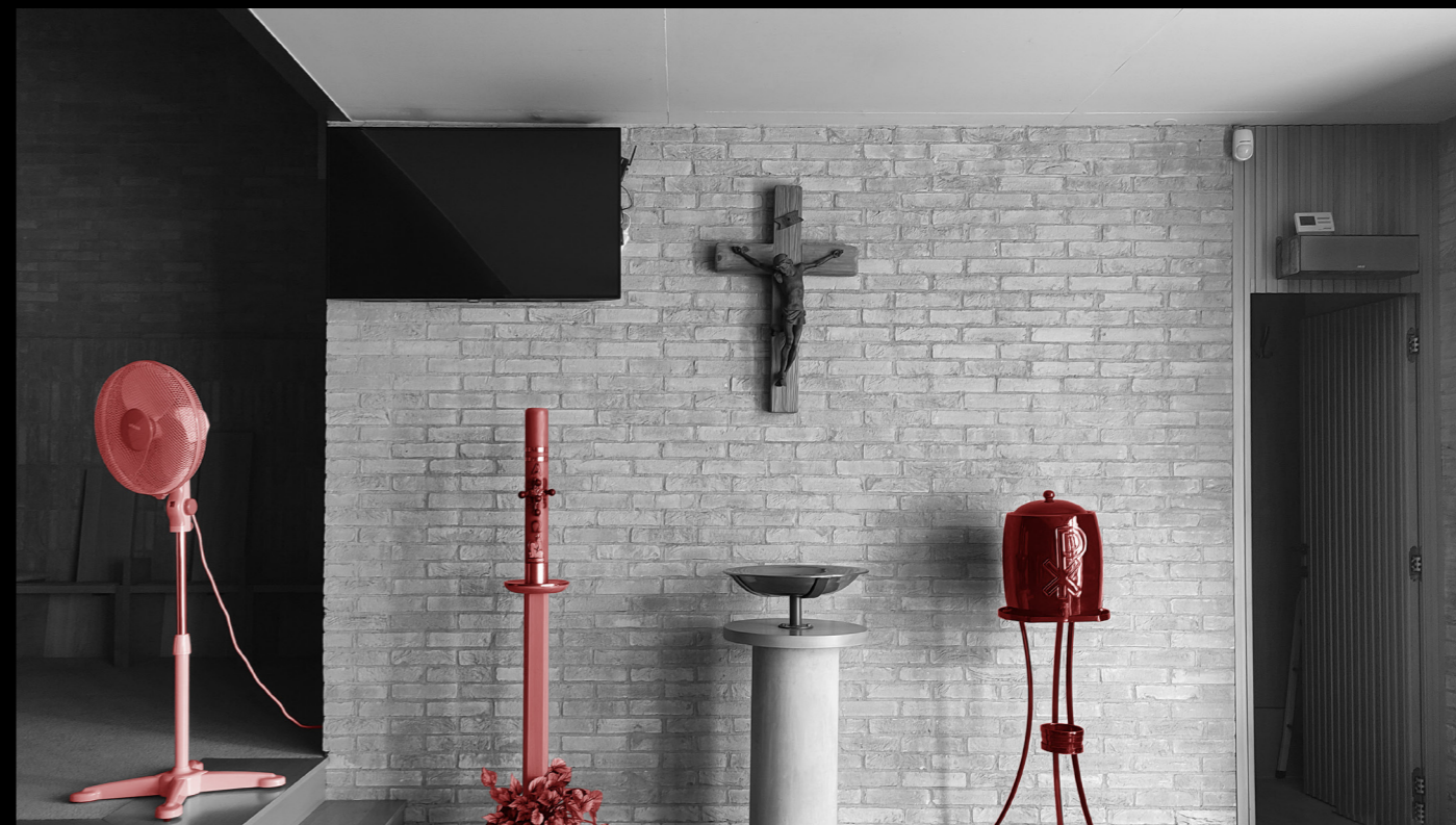
[4]. ábra: A debreceni Szent György-templom belső részlete a feszülettel és a keresztelőkúttal

A karzat hatalmas egybefüggő falfelületére, mely függőleges fa lamellás burkolatot kapott, felkerült Magyarország és Vatikán zászlaja. A plébános és a hitközösség tagjainak beszámolója alapján azért tartották fontosnak a jelképek hangsúlyos megjelenítését, mert erős identitástudatukat szerették volna ilyen formában kifejezésre juttatni. A beszélgetések folyamán azonban egy másik indok is felsejlett a fentiek mögött, mégpedig az, hogy a homogén falfelület monotonitását kívánták valahogy megtörni. Hasonló kettősség jelenik meg a hívek szándékában és kommunikációjában a miséző teret északi irányból határoló nagyméretű üvegfelületet illetően. A tér elsősorú fényforrásaként szolgáló ablaka előtt teljes szélességben szobanövények sokasága lelt otthonra, szószerinti megfogalmazásban azért, "hogy otthonosabb legyen" a tér. A felszíni indoklás mögé tekintve azonban később kiderült számomra, hogy a hagyományos szakrális terekre jellemző zártság és sötétség igénye is motiválhatta ezt a döntést, hisz a hitközösség egy klasszikus vidéki, kistemplomban misézett eddig, ahol nem álltak a szertartás alatt közvetlen kapcsolatban a külvilággal.