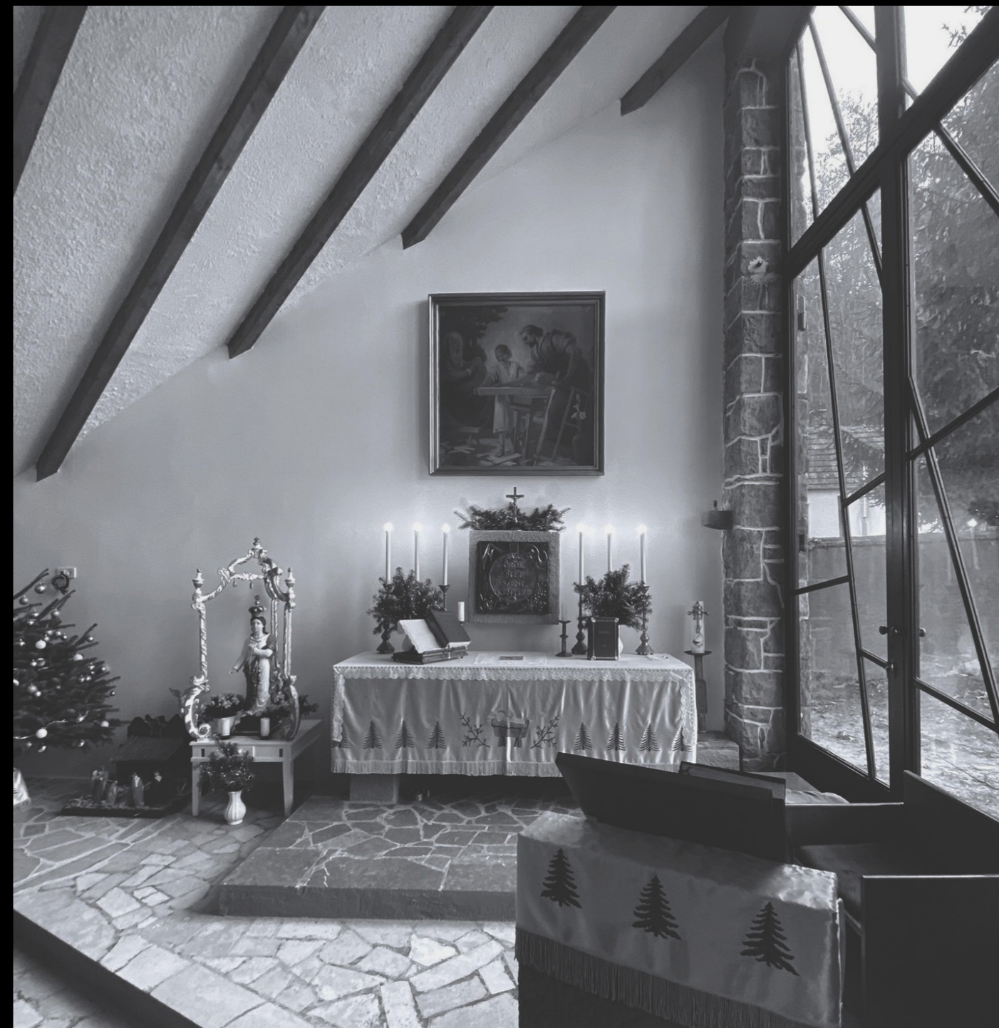
[9]. ábra: A cserépváraljai Munkács Szent József templom belső tere