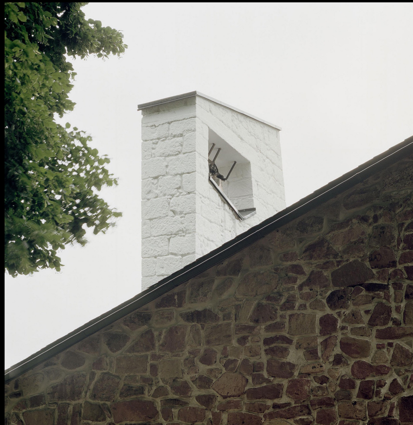
[8]. ábra: A cserépváraljai Munkás Szent József templom külső részlete (Építész: Partizan Architecture) Forrás: Építészfórum (2023) (Fotó: Danyi Balázs).

Az 1961-ben felszentelt templom megépülése magát a reményt jelentette azok számára, akik a szocialista diktatúrában végbement egyházüldözés miatt hitüktől megfosztva kényszerültek élni. Kevés olyan példa van Magyarországon ebből a korszakból, ami ugyan a hagyományos templomformától megfosztottan, de új szakrális épületként létrejöhett. A cserépváraljai templom a megszokott tömegformálás helyett a helyi értékekhez nyúlik inspirációért. Az egyik jellegzetesség, amit felfedezhetünk, az a község telkeinek hátsó kertjében a hegyoldalba vájt barlangok térérzete a misetérben. Az igényesen megmunkált kőfelületek mélyen kötődnek a hegyvidéki település lelkéhez. A riolittúfára tervezett falak alapanyagát a helyi emberek termelték ki és rakták fel "kalákában" ezáltal pusztá kézzel teremtve egy erős, igazán személyes kapcsolatot a templommal.