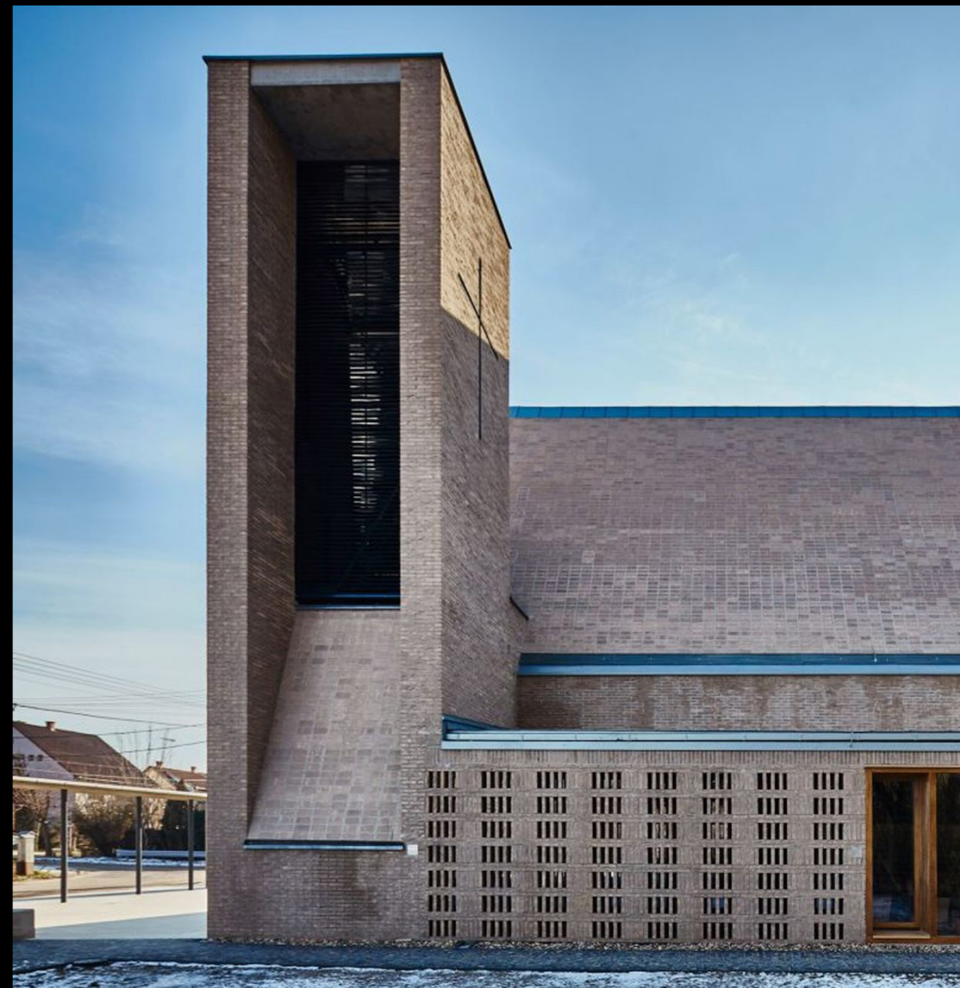
[3]. ábra: A debreceni Szent György-templom külső nézete (Építész: Gyórfy Zoltán).