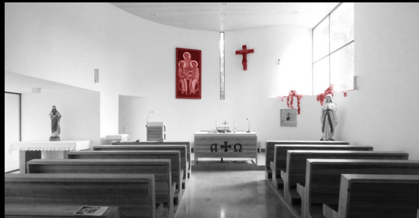
[7]. ábra: A derekegyházi Szentháromság-templom belső tere